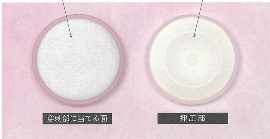
医療用 PE 樹脂

押圧力を効率よく中心部に集中するよう、樹脂部分の中央部がすり鉢状の凹形状になっています。