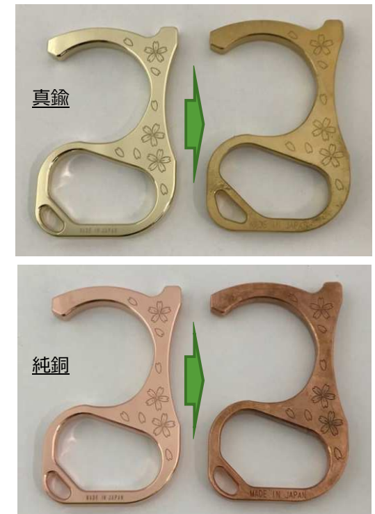
酸化して変色した比較写真

長期間に渡り酸化した状態で放置しておく と「緑青」と呼ばれる無害に等しい錆が発生することがあります。 緑青が発生した場合は #400番程度の耐水ペーパーを使って表面を研磨することで新品同様の状態にすることが可能です。